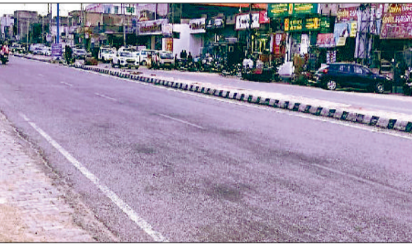
महेंद्रगढ़। नारनौल दादरी स्टेट हाईवे।

शहीद मेजर सतीश दहिया राजकीय कॉलेज के ग्राउंड पर मालिकाना हक पाने की याचिका को सुप्रीम कोर्ट ने खारिज कर दिया। साथ ही याचिकाकर्ता को लोवर कोर्ट में पीटीशन दायर करने का विकल्प दिया गया है, लेकिन हाईकोर्ट के बाद सुप्रीम कोर्ट में कॉलेज को राहत मिलने से ग्राउंड में कैंपस निर्माण का रास्ता साफ हो गया है। अदालती फैसले के बाद विद्यार्थियों ने कॉलेज प्रशासन का आभार जताया है