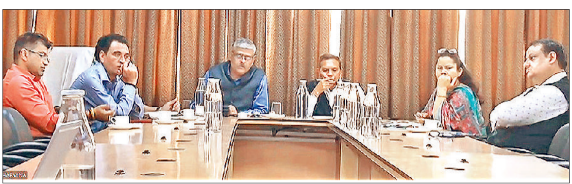
नारनौल। जल मीटिंग के दौरान प्रदेश के अधिकारियों को निर्देश देते मुख्य अभियंता।