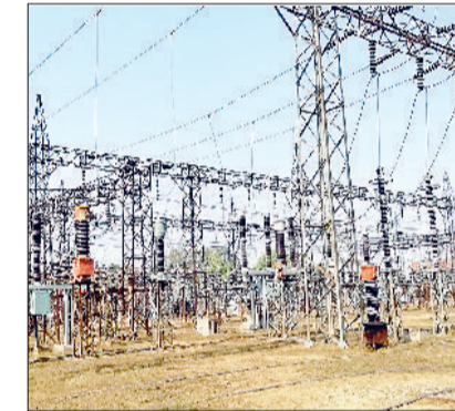
नारनौल। पॉवर हाउस।

गौर हो कि जिले में बिजली निगम की ओर से कुल आठ नए 33 केवी विद्युत सब स्टेशनों की स्थापना प्रस्तावित है। इनमें गांव बेवल, गोमला/मोड़ी, सागरपुर, गौद, बाधोय, डालनवास, बैरावास तथा भारत नगर (सतनाली) शामिल हैं। इन सब स्टेशनों के शुरू होने से जिले के विभिन्न हिस्सों में बिजली वितरण का संतुलन बेहतर होगा। वर्तमान में कई फीडर ओवरलोड चल रहे हैं, जिससे