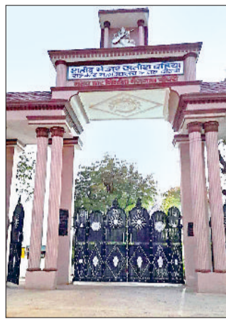
नारनौल। शहीद मेजर सतीश दहिया राजकीय कॉलेज।

है, जिसके हिस्सेदारों ने स्वेच्छा से जमीन को कॉलेज के नाम दान कर दिया था। इसके बाद कॉलेज प्रशासन ने भवन निर्माण की प्रक्रिया शुरू करते हुए उच्चतर शिक्षा निदेशालय को बजट के लिए पत्र लिखा गया, लेकिन इसी दौरान दान की गई जमीन के एक हिस्सेदार ने ग्राउंड पर मालिकाना हक जता दिया। कॉलेज प्रशासन की ओर से इंकार करने पर उन्होंने हाईकोर्ट में याचिका दायर की, लेकिन राहत नहीं मिली। इसके बाद याचिकाकर्ता ने सुप्रीम कोर्ट में मामला दायर किया, लेकिन दोनों पक्षों की दलीलें सुनने के बाद अदालत ने याचिका को खारिज कर दिया, लेकिन याचिकाकर्ता को लोवर कोर्ट में पीटीशन दायर करने का विकल्प दिया गया है।