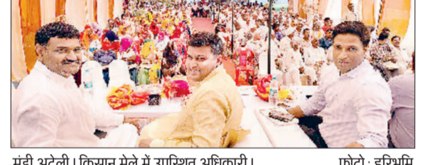
मंडी अटेली। किसान मेले में उपस्थित अधिकारी।