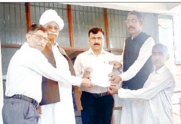
नारनौल। प्रशासन को ज्ञापन सौंपते सचेत नागरिक मंच के पदाधिकारी।

बल्कि समाज के वंचित व पिछड़े लोगों को मुख्यधारा में शामिल करने का एक प्रयास मात्र है। इन निर्देशों के लागू होने से किसी का कोई भी किसी किस्म का नुकसान नहीं है। उन्होंने कहा कि इन दिशा-निर्देशों में नियमों के विरुद्ध फैलाई जा रहे भ्रम