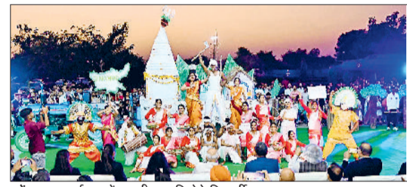
महेंद्रगढ़। कार्यक्रम में अपनी प्रस्तुति देते विद्यार्थी।